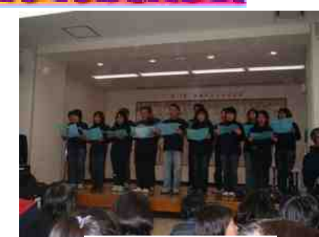
かざぐるま舎の皆さん