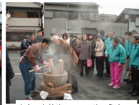
もちつき始め 一つめのうす