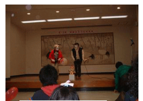
公民館グループの皆さん