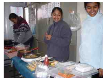
スリランカ喫茶コーナー