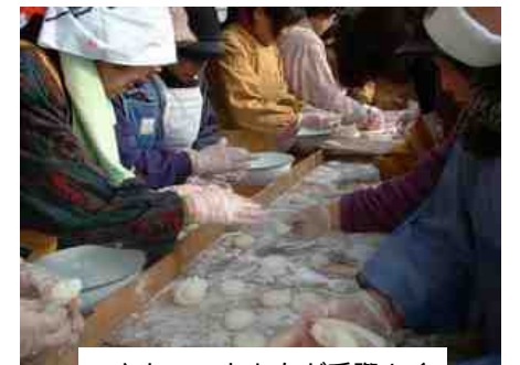
つきたてのおもちが手際よく丸められていきます