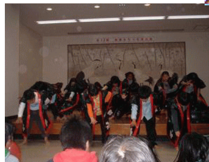
己斐東児童館とkoiダンスジュニアの子ども